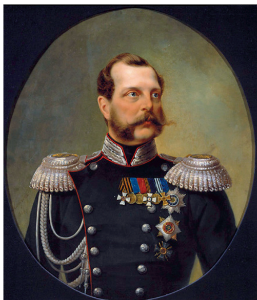
Портрет императора Александра II. 1868 г. Худ. Н.А. Лавров

судов из числа офицеров, получивших юридическое образование. В целях реализации этой задачи в 1866 г. профессорам Санкт-Петербургского университета А.П. Чебышеву-Дмитриеву и А.В. Лохвицкому было поручено ознакомить с основами уголовного права и судопроизводства генералов и штаб-офицеров, намеченных в председатели и судьи предположенных к открытию петербургского и московского военно-окружных судов. А 26 апреля 1866 г. повелено было при Аудиторском училище открыть офицерские классы из двух курсов. В число их слушателей принимаются 35 штаб- и обер-офицеров армии и 5 офицеров флота. Занятия в классах начинаются 20 августа 1866 г. [2].