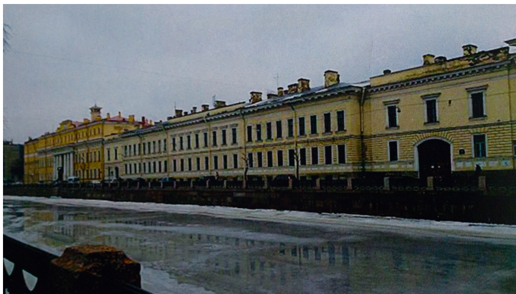
Комплекс зданий бывшей Александровской военно-юридической академии на набережной реки Мойка в Санкт-Петербурге (фото 2015 г.). Возводился в течение 1806–1808 гг. Постройка является образцом классицизма

– Ю.Р.) – историка русского юридического быта и выдающегося цивилиста, дать возможность воспитанникам академии услышать горячее, вдохновенное и полноценное слово старого профессора лучших времен Московского университета. Не только в серьезной любви к науке нашел Бобровский точку тесного соприкосновения с Кавелиным, питавшем к нему искреннее уважение, – чем он дарил не многих, но и в одной общей нежной любви к Петру» [9].