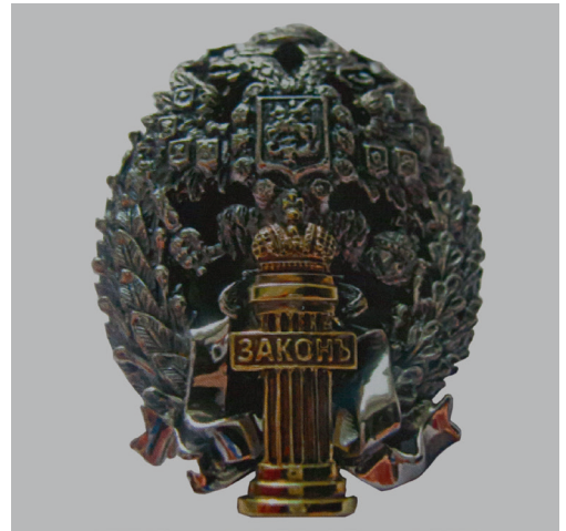
Знак за окончание Александровской военно-юридической академии

мии руководил известный общественный деятель, активный участник подготовки отмены крепостного права, выдающийся юрист К.Д. Кавелин. Он стремился показать слушателям прежде всего происхождение, развитие права, определить его роль в обществе [6].