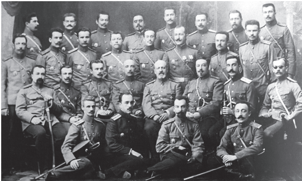
Один из выпусков Александровской военно-юридической академии

физиологией, психология и логика, история русского военного законодательства и военно-уголовные законы иностранных держав. Кроме того, в первом и во втором классах проводились занятия по русскому, французскому и немецкому языкам, а в старшем классе – практические занятия по военному судопроизводству. По окончании курса каждый офицер представлял письменную работу на заданную тему по одному из главных предметов.